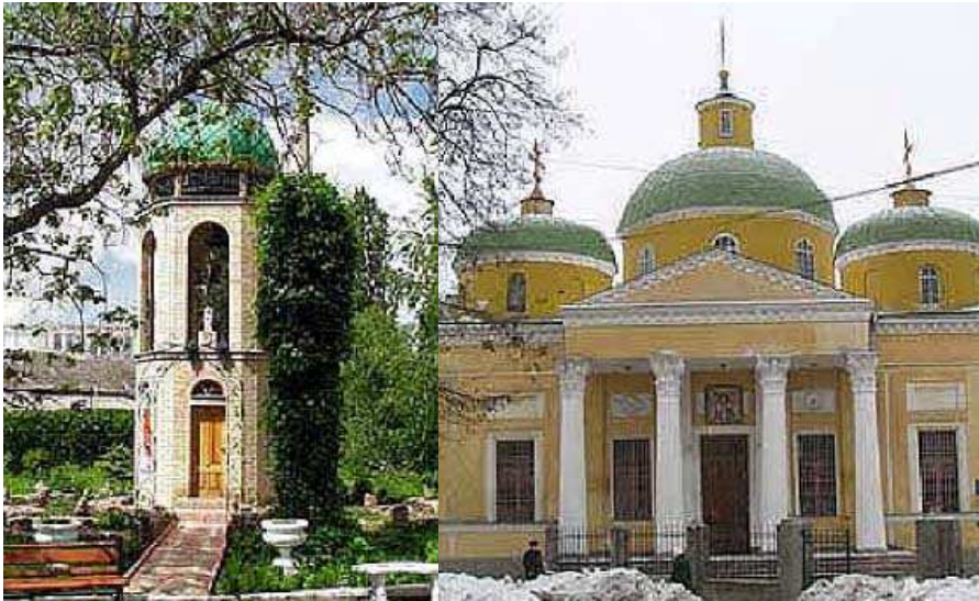
Церква Преображення Господня

У 1805 р. на місці будівлі, що згоріла, заклали кам'яну Свято-Преображенську церкву.