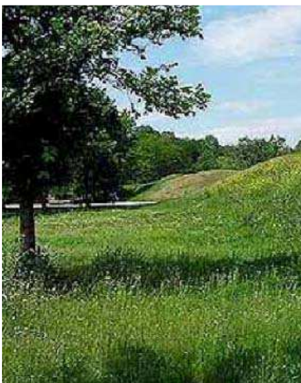
Залишки валів фортеці Св. Єлисавети

Будівництво фортеці в межиріччі Інгулу і Сугоклеї було обумовлено історичною необхідністю. Воно почалося 18 червня 1754 року.