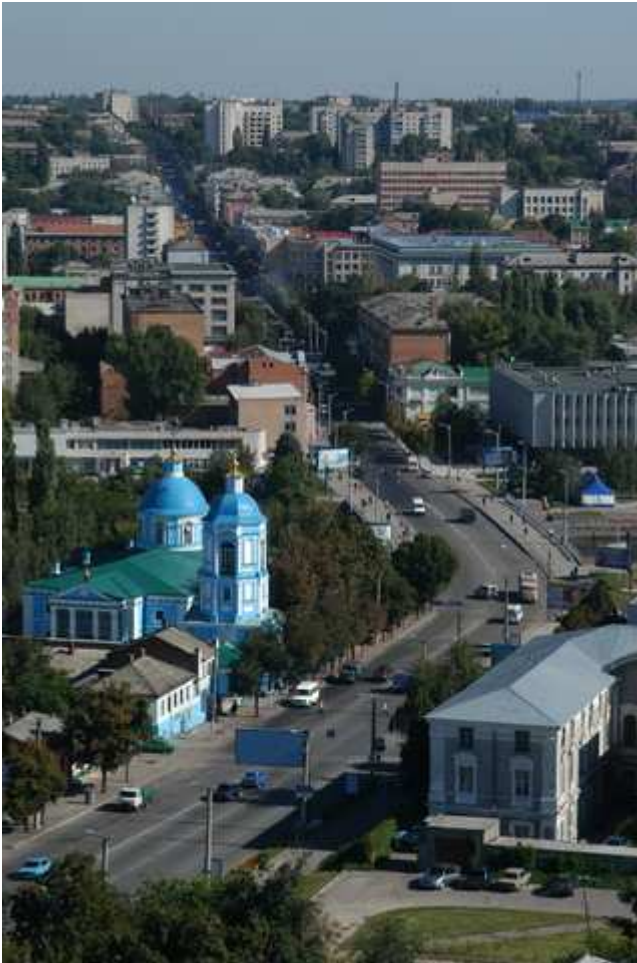
Вулиці сучасного Кіровограду - центр міста