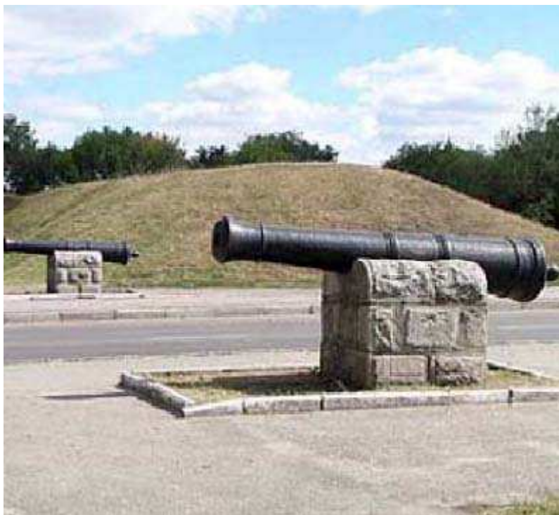
Гармати на території фортеці Св. Єлизавети

Збереглися дві гармати, що стоять на п'єдесталах при в'їзді на територію фортеці.